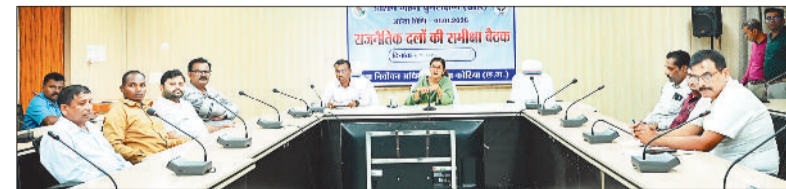
बैठक लेती कलेक्टर।

मसौदा सूची पर दावे एवं आपत्तियां 9 दिसंबर से 8 जनवरी 2026 तक प्राप्त की जाएंगी। इनका परीक्षण, नोटिस, सुनवाई एवं सत्यापन कार्य 31 जनवरी तक किया जाएगा। अंतिम मतदाता सूची का प्रकाशन 7 फरवरी को होगा।