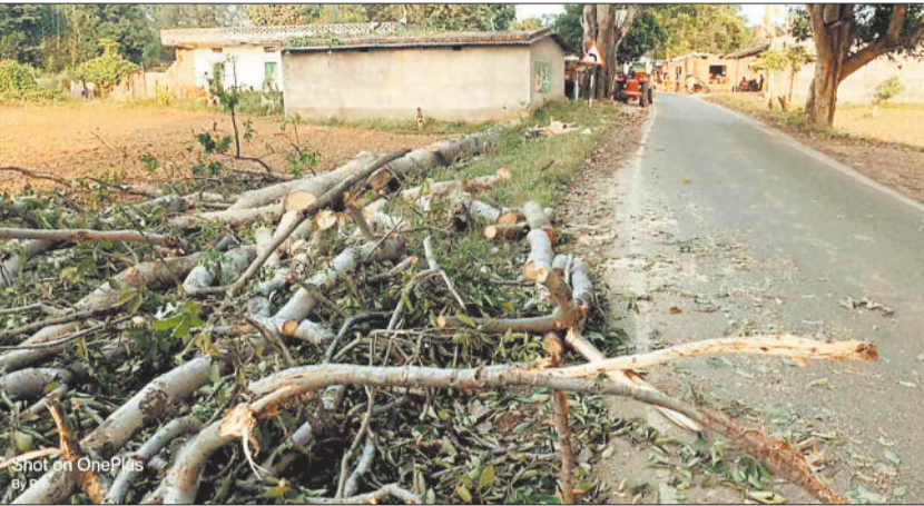
सड़क किनारे काटे गए पेड़।

क्षेत्र स्थित जंगलों से लम्बे समय से लकड़ी की तस्क़री की जा रही है जो आज भी जारी है। तस्क़र इतने शांतिर है कि खुद तो सामने कम आते हैं परंतु गांव के लोगों को मोटी राशि कमाने का झांसा देकर काम पर लगा देते हैं। जंगल में पेड़ों की अवैध कटाई पर वन विभाग की टीम ने कुछ हद तक ने अंकुश लगाया है लेकिन लकड़ी तस्क़र अब