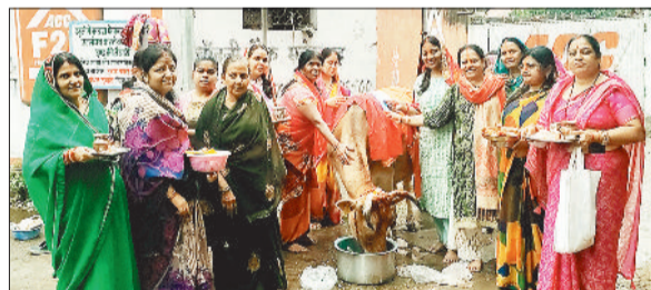
पर्व मनाती महिलाएं।

जगह गौ माता की पूजा-अर्चना कर लोगों ने गौ-सेवा और संरक्षण का संकल्प लिया। पर्व के अवसर पर श्रद्धालुओं द्वारा गौ माता को स्नान, तिलक, पुष्प और गुड़-चारे का भोग अर्पित किया गया। कई स्थानों पर भजन-कीर्तन और धार्मिक कार्यक्रम आयोजित हुए। इनमें महिलाओं और बच्चों ने