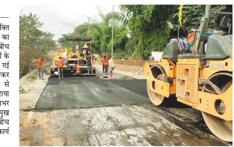
पैच रिपेयरिंग का काम शुरू किया गया।

सरगुजा में इस बार मानसून में जमकर बारिश हुई। समय से पहले पहुंचे मानसून के कारण सड़कों के मरम्मत का कार्य नहीं हुआ और फिर जोरदार बारिश के कारण सड़कों की स्थिति बेहद दयनीय हो गई। वाहनों के आवागमन से सड़कों पर बड़े बड़े गड्ढे हो गए जिससे लोगों को ख़ासी परेशानियों का सामना करना पड़ा। गड्ढों और कीचड़ युक्त सड़क के कारण लोड आए दिन दुर्घटना के शिकार हुए। इस दौरान लोगों ने शहर में सड़कों के निर्माण को लेकर नाराजगी जाहिर की जबकि